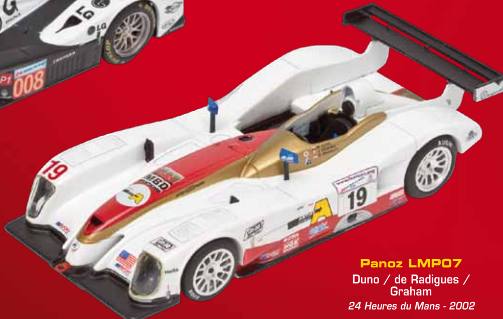
Panoz LMP07 Duno / de Radigues / Graham 24 Heures du Mans - 2002