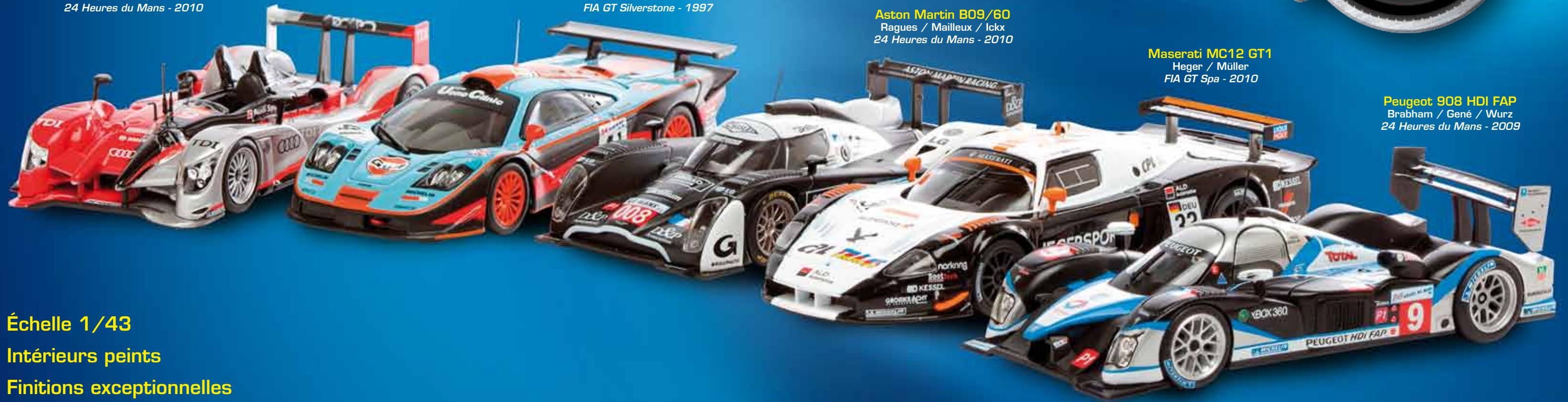
Peugeot 908 HDI FAP Brabham / Gené / Wurz 24 Heures du Mans - 2009