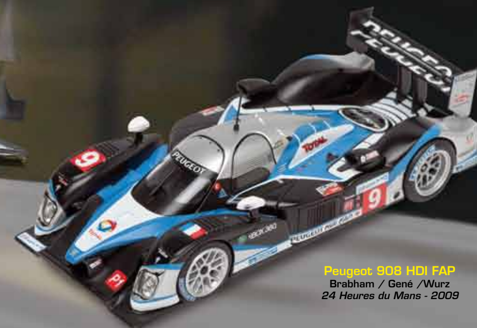
Peugeot 908 HDI FAP Brabham / Gené / Wurz 24 Heures du Mans - 2009