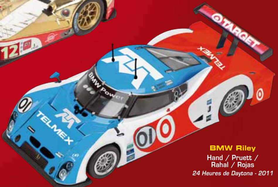
BMW Riley Hand / Pruett / Rahal / Rojas 24 Heures de Daytona - 2011