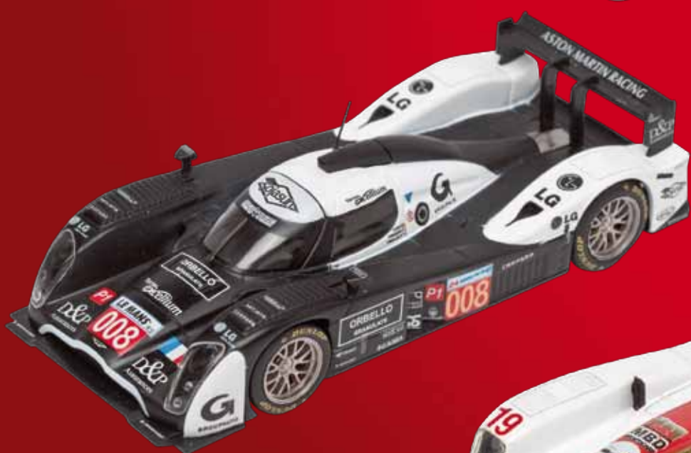
Aston Martin B09/60 Ragues / Mailloux / Ickx 24 Heures du Mans - 2010