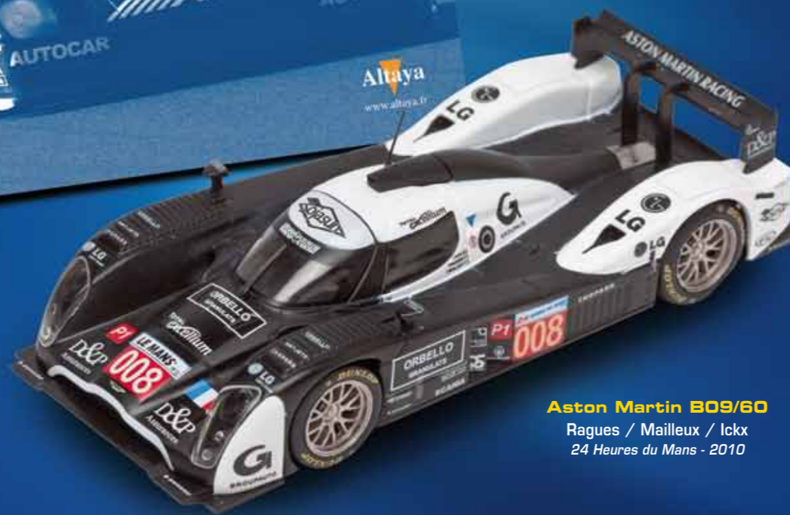
Aston Martin B09/60 Ragues / Mailloux / Ickx 24 Heures du Mans - 2010