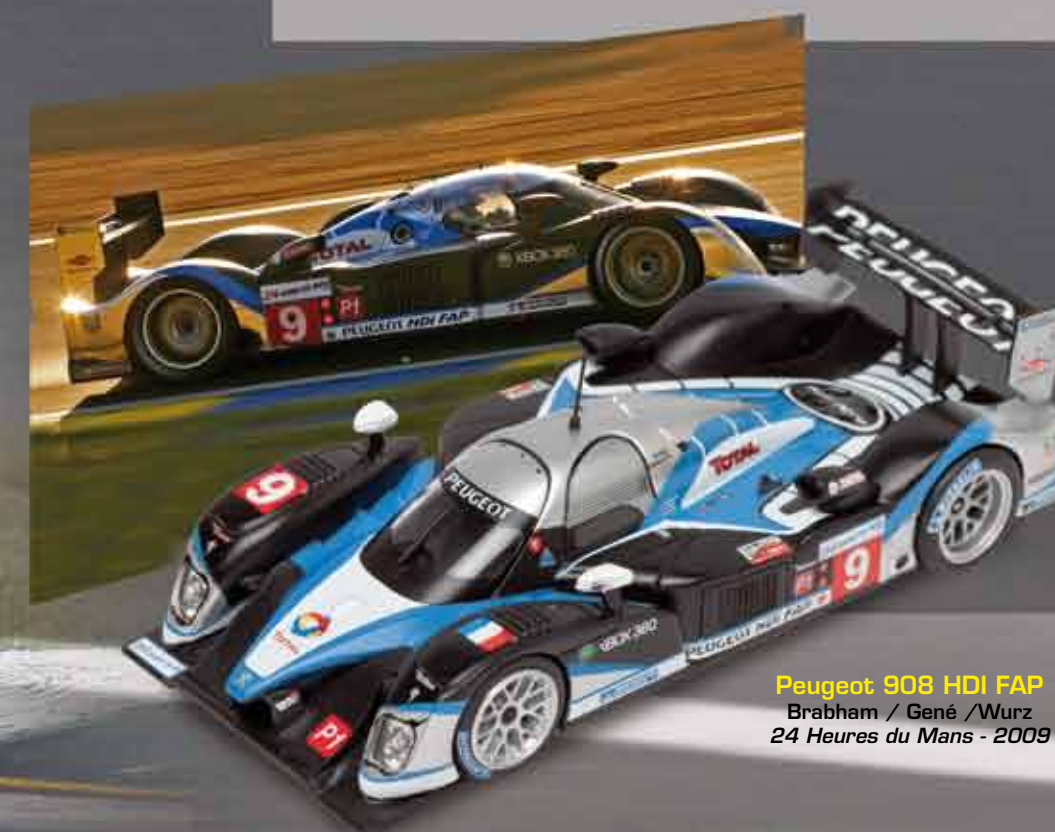
Peugeot 908 HDI FAP Brabham / Gené / Wurz 24 Heures du Mans - 2009