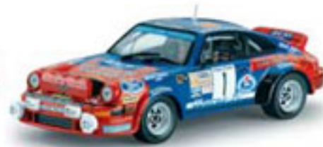
1980 PORSCHE 911 SC A. Zanini / J. Sabater