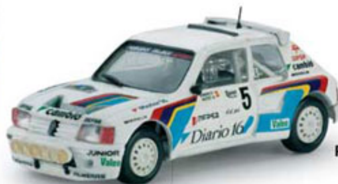
1985 PEUGEOT 205 T-16 A. Zanini / J. Autet