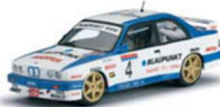
1989 BMW M3 P. Bassas / A. Rodríguez