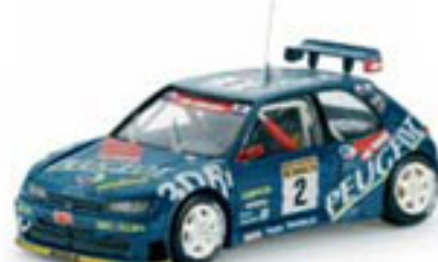
1997 PEUGEOT 306 MAXI J. Azcona / J. Billmaier