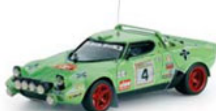
1979 LANCIA STRATOS HF J. de Bagration / N. Llopis