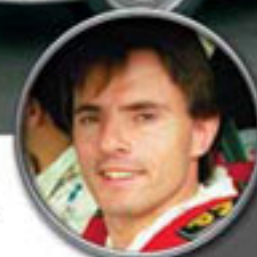
BMW M3 P. Bassas / A. Rodríguez