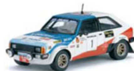
1982 TALBOT SUNBEAM LOTUS A. Zanini / V. Sabater