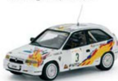
1993 OPEL ASTRA GSI J. M o . Bardolet / J. Muntada