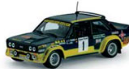
1979 FIAT 131 ABARTH B. Fernández / J. L. Sala