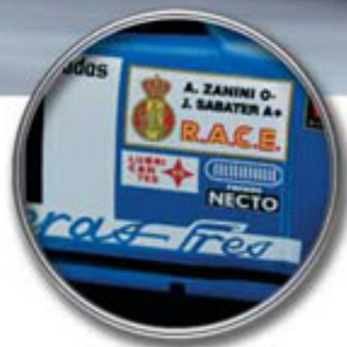
Reproducciones totalmente fieles al modelo original