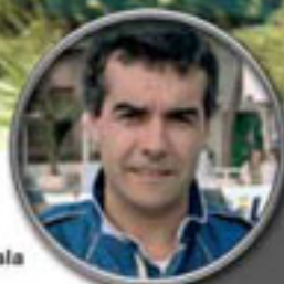
FIAT 131 ABARTH B. Fernández / J. L. Sala