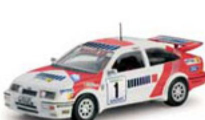
1988 FORD SIERRA RS COSWORTH C. Sainz / L. Moya