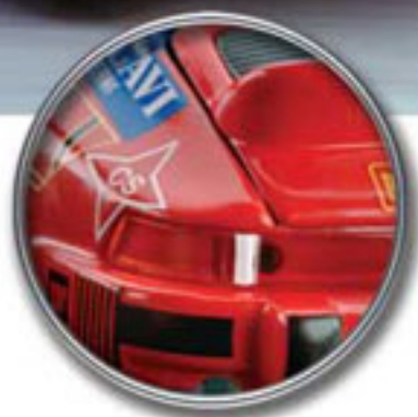
Modelos de metal inyectado con acabados de gran calidad