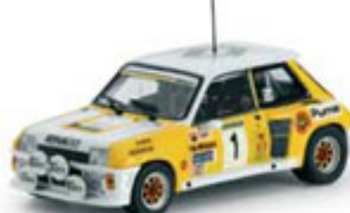
1983 RENAULT 5 TURBO G. Ortiz / R. Minguez