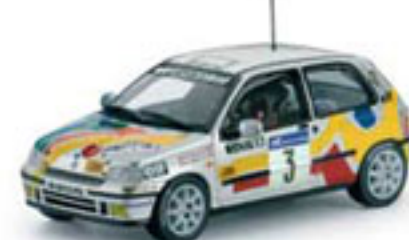
1994 RENAULT CLIO WILLIAMS O. Gómez / M. Martí