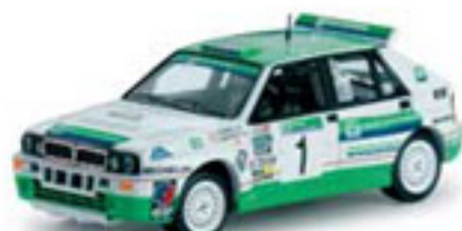
1992 LANCIA DELTA HF INTEGRALE J. Puras / J. Arrate