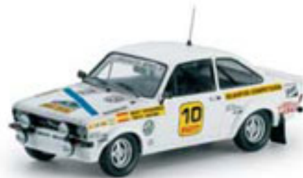
1977 FORD ESCORT MKII 1800 RS B. Fernández / A. Doural