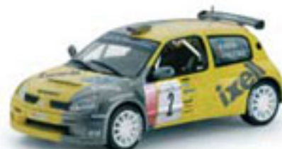
2004 RENAULT CLIO SUPER 1600 A. Hevia / A. Iglesias