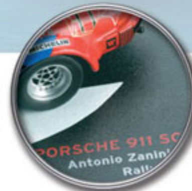
Peana de soporte con los datos del vehículo