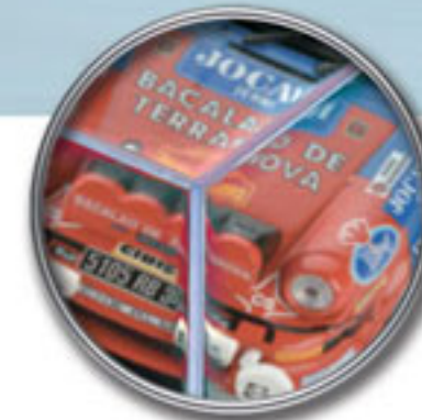
Caja de plástico protectora

Los modelos aquí presentados pueden sufrir variaciones por imperativos técnicos apenas a la editorial.