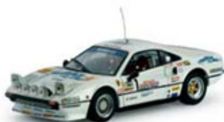
1984 FERRARI 308 GTB A. Zanini / J. Autet