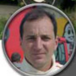
LANCIA DELTA HF INTEGRALE J. Puras / J. Arrate