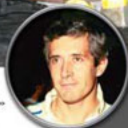
PORSCHE 911 SC "Almérés" A. Zanini / J. Sabater