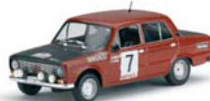
1972 SEAT 124-1600 S. Cañellas / D. Ferrater